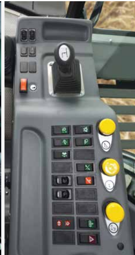
Bedienkonsole mit perfekter Übersicht

Bei der Entwicklung der Comfort-Kabine war das Ziel eine ideale, produktive Arbeitsumgebung, die höchste Bedienfreundlichkeit und optimalen Komfort vereint und dem Fahrer so selbst nach vielstündigem Einsatz noch ein angenehmes Arbeiten ermöglicht. Dank dem Bordcomputer Agritronic Plus hat der Fahrer von seinem Sitz aus jederzeit den gesamten Mähdrescher unter Kontrolle. Die Bedienelemente sind ergonomisch angeordnet und erlauben so die unkomplizierte, mühelose Handhabung des Mähdreschers. Ausstattungsmerkmale wie z. B. der luftgefederte Fahrersitz, verstellbare beheizte Rückspiegel sowie der beeindruckende Panoramablick gehören zum Standardlieferumfang.